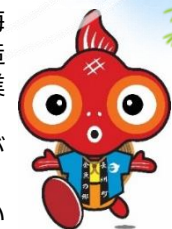
長洲町マスコットキャラクター ふれきんちゃん

毎年5月と10月に開催する「火の国長洲金魚まつり」や「金魚と鯉の郷まつり」をはじめ、各種イベントを通して、「金魚のまち=長洲」をPRしています。