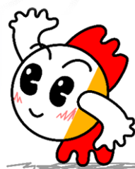
弥富市マスコットキャラクター きんちゃん

平成8年には、弥富で誕生した「桜錦」が18年ぶりに国内の新品種として認定され、近年では令和4年10月、弥富まちなか交流館に「弥富金魚水族館(YaToMi AQUA)」がオープンし、金魚の展示や常設の金魚すくいコーナーにより、「金魚のまち弥富」を市内外に広く発信しています。