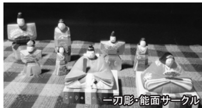
一刀彫・能面サークル